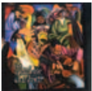
The Rainbow Children