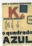
K4 Quadrado Azul Almada Negreiros (1917) 6.000€

Depois, há o autor português "incontornável", aquele que está (e estará, arriscam) sempre em alta: Fernando Pessoa. "É um paradigma", seja em livro, revista literária (ver Top Nacional) ou folheto "é sempre uma obra muito, muito procurada". ■