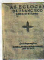
Eglogas Francisco Rodrigues Lobo (1605) 5.000 €

Rara primeira edição de um clássico da literatura portuguesa do século XVI, contém as suas eglogas e cartas dirigidas ao "príncipe e sereníssimo senhor Dom Álvaro D'Allemcastro, duque de Aveiro". ■