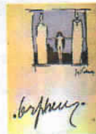
Revista Orpheu Vários (1915) 5.000 €