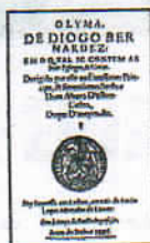
OLYMA Diogo Bernardes (1596) 5.750 €

Folheto satírico de 20 páginas editado em Portugal no ano de 1917. A obra retrata a relação de duas personagens que, de forma metafórica, o autor associa à geometria e à verdade absoluta das coisas. ■